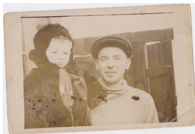
Отец и сын у дома по ул. Герцена