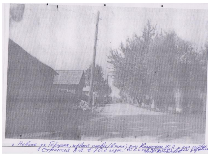
Копия со снимка Ю.Л. Колондука. Комментарии автора.