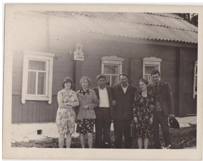
Семья Колондук у родительского дома.