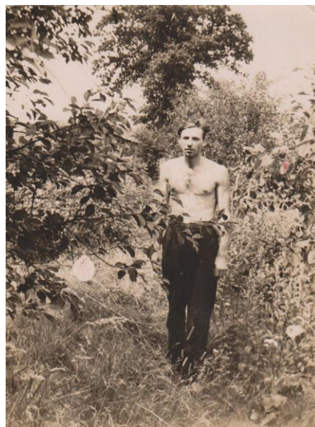
В саду по адресу: ул. Герцена д. 62, начало 50-х годов 20 века.