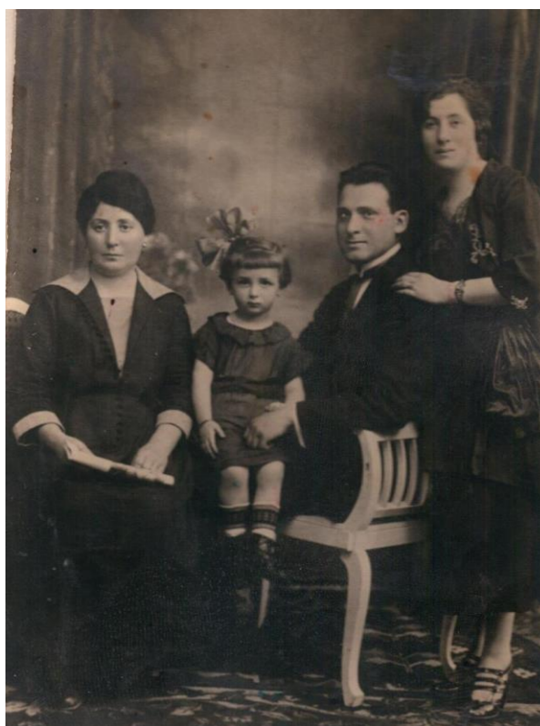
Слева бабушка Берты. Справа отец и мать.